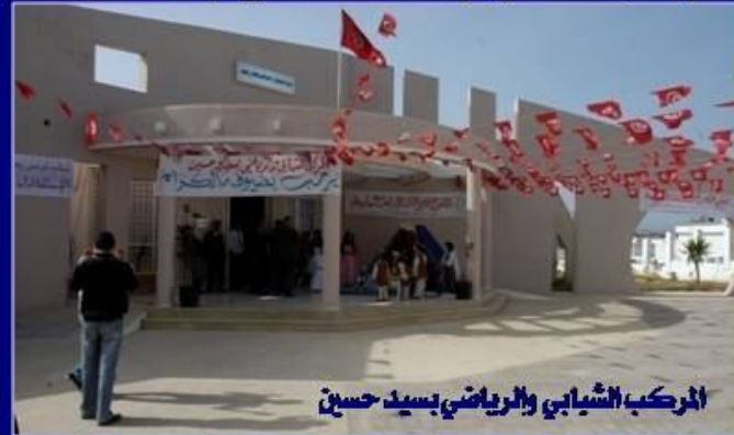
المركب الشبابي والرياضي بسيد حسين

وإجمالا يقدر حجم الاستثمارات في البنية الأساسية الشبابية والرياضية سنتي 2009 و 2010 حوالي 108,5 م.د (26 منها بصفة استثنائية).