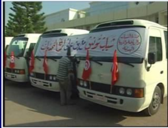
موكب تسليم حافلات الإعلامية الأنترنت / 10 أكتوبر 2009

في إطار الخطة الوطنية لنشر الثقافة الرقمية، وتيسيرا لانخراط الشباب في مجتمع المعلومات والتعامل الإيجابي مع التكنولوجيا الحديثة للمعلومات والاتصالات: